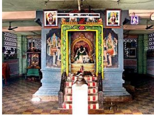
மாயாண்டி ஸ்வாமிகள் சன்னதி

அதன்பின் ஸ்வாமிகள் பல இடங்களுக்கும் விஜயம் செய்து பக்தி மார்க்கத்தைப் பரப்பியவண்ணம் பக்தர்களுக்கு அருளாசி தந்து அவர்களுடைய வாழ்க்கை பிரச்சனைகளை தமது சக்தியினால் தீர்த்து வைத்தார் . பல இடங்களில் வழிபாட்டு மன்றங்களை நிறுவினார். அவருடைய சக்திக்கு எடுத்துக் கட்டாக ஒரு சம்பவம் நடந்தது. அவர் ஒருமுறை ரயிலில் டிக்கட் இன்றி பயணம் செய்து கொண்டு இருந்தபோது பரிசோதனையில் அதை கண்டுபிடித்த பரிசோதகர் ரயிலை நிறுத்தி அவரை அத்வானமான இடத்தில் இறக்கி விட்டார். அந்தோ பரிதாபம் விசித்திரமாக ரயில் பழுதடைந்து விட மீண்டும் அவரை ரயிலில் மீண்டும் சுவாமிகளை ஏற்றிக் கொள்ளாதவரை ரயிலை கிளப்ப முடியவில்லையாம்.